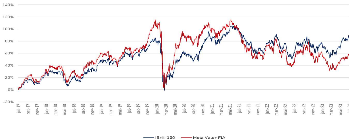
Retorno 72 meses

Banco 707 - Banco Daycoval Agência 001 Conta 736736-0 Horário limite 14:00 Aplicação inicial R$ 5.000,00 Movimentação mínima R$ 5.000,00 Cotização aplicação D+1 Cotização resgate D+1 Pagamento resgate D+2 da cotização Tributação Renda variável - 15% Taxa de administração 2,5% a. a. / máx. 3,0% a. a. Taxa de performance 20% sobre o excesso do IBX Categoria ANBIMA Ações IBrX Ativo